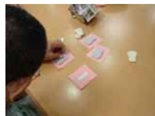
紙にスポンジを張ります