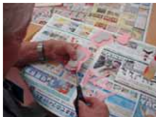
切り込みを入れます