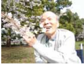
いい香りですねえ！