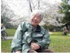
桜をバックに、ハイポーズ！

桜の木の下で「わあ」とつても綺麗だわ」「散ってしまうのがもったいないわあ」などのお声飛び交いました。桜の下で円になると、誰からともなく「さくらくら」と、さくらの歌を口ずさむ声が聞こえてきました。