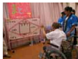
的あてゲームに熱中！

ご家族様・ボランティアの方々・職員が一緒にになり、踊りを楽しまれていらっしやいました。