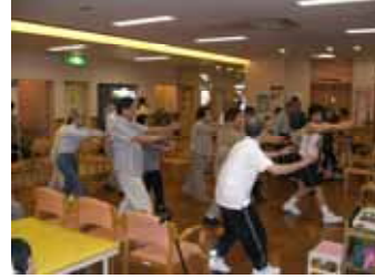
音楽にあわせ、ノッています

リハビリテーション部ではメニューの一つにエアロビクスを取り入れていています。スポーツ経験のない方でも気軽に楽しくできる有酸素運動です。全身の様々な動きを組み合わせ、専門