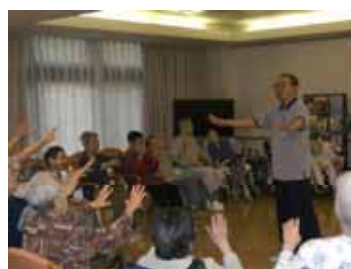
ラジオ体操の音楽にあわせて

昔から慣れ親しんできたラジオ体操をご利用様の体に負担のないようにアレンジし、普段は意識して動かすことのない手指を積極的に動かす車椅子体操を行っています。