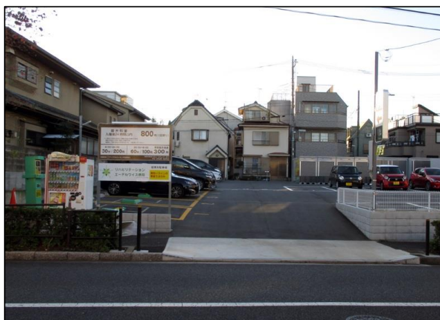
【提携コインパーキング正面図】